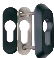
Detalle del escudo E210